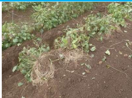
↑カノコソウを畑から掘り上げた状態